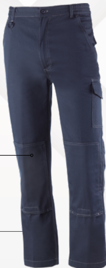
839BL Azul Marino Azul Marinho