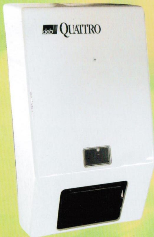
Dispensador de jabón líquido.