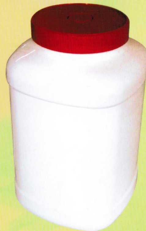
Jabón hipoalergénico en gel. Para suciedades industriales y muy intensas. Enriquecido con vitamina F.